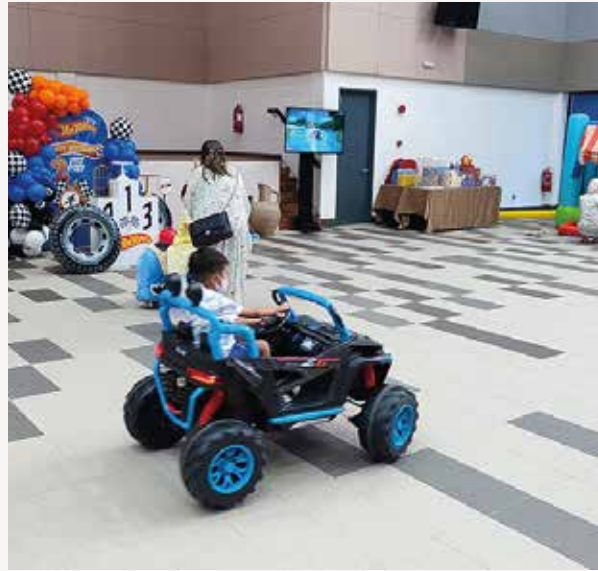
Majlis Sambutan Hari Lahir